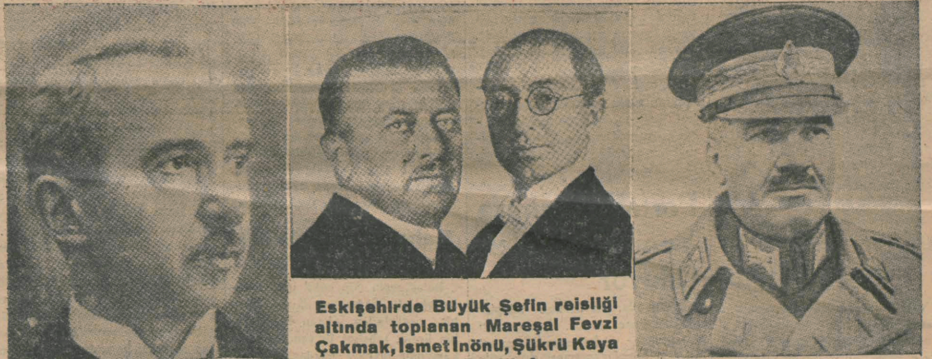
Eskişehirde Büyük Şefin reisliği altında toplanan Mareşal Fevzi Çakmak, İsmet İnönü, Şükrü Kaya ve Tevfik Rüşdü Aras

Arap vahdetini bozmamak üzere Türk tezinin behemehal tahakkuk ettirilmesi kararındayız..